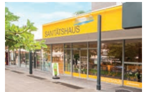
Sanitätshaus Lettermann in Krefeld, Uerdinger Straße 279, 47800 Krefeld

Lettermann Ihr Partner im Gesundheitswesen Wir sind für Sie da!