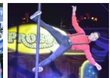
Premiere Weihnachtszirkus Probst