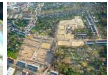
Aus der Luft Gelsenkirchen von oben