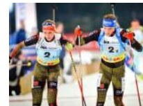
Biathlon Biathlon-Elite in der Veltins-Arena