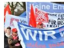
Vaillant Demo Protestzug zieht durch Innenstadt