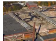
Aus der Luft Abriss des Opelwerks