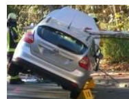
Unfall Auto von Schranke aufgespießt