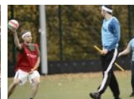
Muggels willkommen Quidditch spielen wie Harry Potter