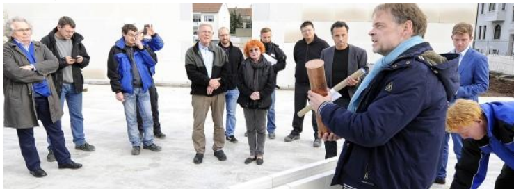
Der Grundstein für den ersten Bauabschnitt im Bereich Pflege ist gelegt. Dazu wurde symbolisch eine Zeitkapsel eingemauert. In einem weiteren Bauabschnitt entsteht später barrierefreies Wohnen auf dem Gelände.

Riemke. Das Fundament ist gegossen, die ersten Wände sind hochgezogen. Schon jetzt ist das frühere Grundstück der Bäckerei Fork Auf dem Dahlacker kaum wiederzuerkennen. Dabei lassen sich die Ausmaße des Bauprojekts in Gänze noch gar nicht erschließen. Über 6000 Quadratmeter groß ist die Gesamtfläche, davon sind wiederum über 4000 Quadratmeter als Wohn- und Nutzfläche ausgewiesen. Bis Herbst 2016 soll die Seniorenresidenz Riemke stehen. In dieser Woche fand die Grundsteinlegung für den ersten Bauabschnitt im Bereich Pflege statt.