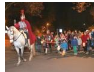
Altenbochum Ökumenischer Martinszug